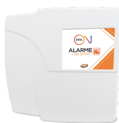
ALARMA C36 SMART ON