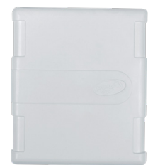
ALARMA C40 SMART ON