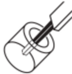
Medición de profundidad