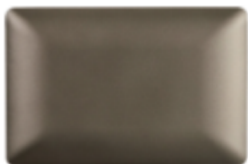
PLACA CIEGA C/SOPORTE CÓDIGO:4964