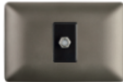
TOMA COAXIAL ARMADA RG6 CÓDIGO:4944