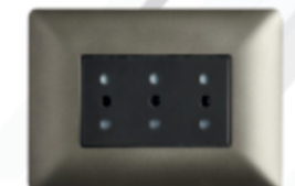
ENCHUFE TRIPLEX PUNTEADO 10A 250V CÓDIGO:4928