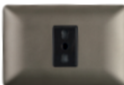
ENCHUFE SIMPLE BIPASO 10/16A CÓDIGO:4919