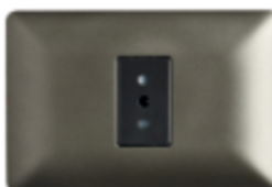
ENCHUFE SIMPLE 10A