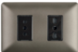
ENCHUFE SIMPLE 10A +ENCHUFE BIPASO 10/16A CÓDIGO:4922