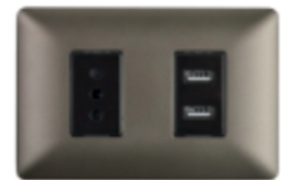
ENCHUFE SIMPLE 10A + TOMA USB DOBLE CÓDIGO:4948