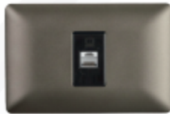
TOMA RED ARMADA RJ45 CAT6E CÓDIGO:4943