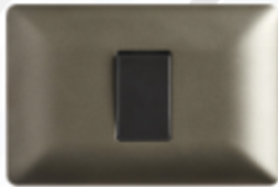
INTERRUPTOR SIMPLE 9/12 16A CÓDIGO:4911