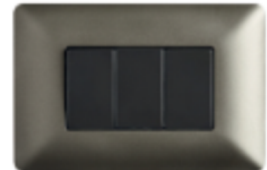
INTERRUPTOR TRIPLE 9/32 16A CÓDIGO:4913