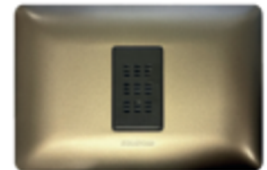
TIMBRE DING DONG CÓDIGO:3949