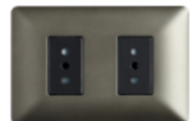
ENCHUFE DOBLE 10A CÓDIGO:4917