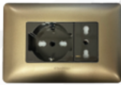
ENCHUFE SCHUKO CÓDIGO:4929