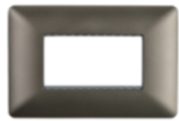
PLACA TRIPLE C/SOPORTE CÓDIGO:4963