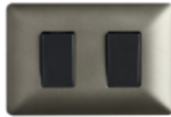
INTERRUPTOR DOBLE 9/15 16A