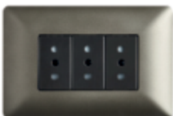
ENCHUFE TRIPLE 10A CÓDIGO:4918