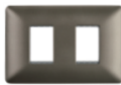
PLACA DOBLE C/SOPORTE CÓDIGO:4962