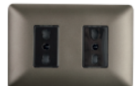
ENCHUFE DOBLE BIPASO 10/16A CÓDIGO:4920