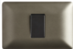
INTERRUPTOR CONMUTADOR 9/24 16A CÓDIGO:4914