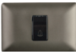
PULSADOR TIMBRE 16A CÓDIGO:4941