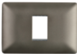
PLACA SIMPLE C/SOPORTE CÓDIGO:4961