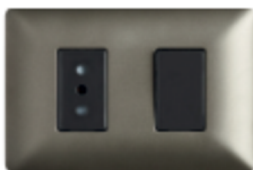
ENCHUFE SIMPLE 10A +INTERRUPTOR 9/12 CÓDIGO:4915