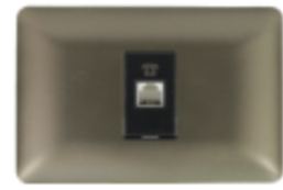
TOMA TELEFÓNICA ARMADA RJ11 CÓDIGO:4942