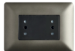
ENCHUFE DUPLEX PUNTEADO 10A 250V CÓDIGO:4927