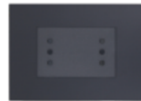
ENCHUFE DUPLEX PUNTEADO 10A 250V CÓDIGO:7927