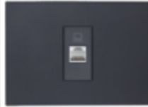
TOMA RED RJ45 CAT6E CÓDIGO:7951