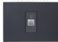
TOMA TELEFÓNICA RJ11 CÓDIGO:7942