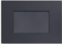
INTERRUPTOR CONMUTADOR TECLÓN 9/24 10A CÓDIGO:7914TCL