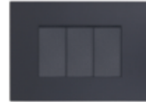
INTERRUPTOR TRIPLE 9/32 16A CÓDIGO:7913