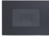
ENCHUFE SCHUKO + ENCHUFE SIMPLE BIPASO CÓDIGO:7930