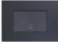
PULSADOR TIMBRE 16A TECLÓN CÓDIGO:7941TCL