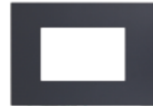
PLACA TRIPLE C/SOPORTE CÓDIGO:7963