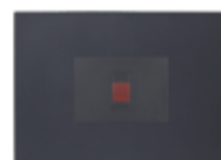
INTERRUPTOR ENCIMERO CÓDIGO:7940