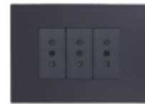
ENCHUFE TRIPLE 10A CÓDIGO:7918