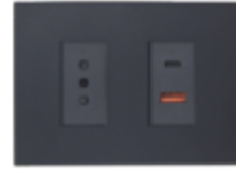
ENCHUFE SIMPLE + TOMA USB TIPO A Y C CÓDIGO:7950