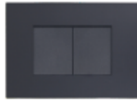
INTERRUPTOR DOBLE TECLON 9/15 16A CÓDIGO:7912TCL