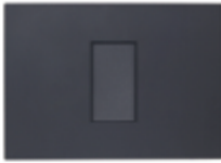
INTERRUPTOR SIMPLE TECLON 9/12 16A CÓDIGO:7911TCL