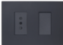
ENCHUFE SIMPLE 10A +INTERRUPTOR 9/12 CÓDIGO:7915