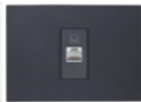
TOMA RED RJ45 CAT5E CÓDIGO:7943