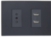
ENCHUFE SIMPLE 10A + TOMA USB DOBLE CÓDIGO:7948