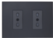
ENCHUFE DOBLE BIPASO 10/16A CÓDIGO:7920