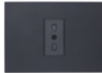
ENCHUFE SIMPLE BIPASO 10/16A CÓDIGO:7919