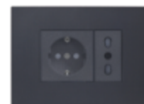
ENCHUFE SCHUKO + ENCHUFE SIMPLE BIPASO CÓDIGO:7930