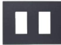
PLACA DOBLE C/SOPORTE CÓDIGO:7962