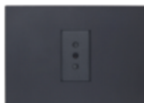
ENCHUFE SIMPLE 10A CÓDIGO:7916