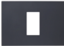
PLACA SIMPLE C/SOPORTE CÓDIGO:7961